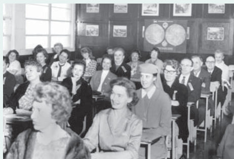
ENCIMA - En 1963, se inscribieron 5,000 catequistas en las conferencias realizadas en el Immaculate Heart College en Los Angeles. ABAJO - La Liturgia de clausura en el Arena de Anaheim en el Congreso de 1974, con el tema "Jesus, Others, You."

Hoy en día, el Congreso de Educación Religiosa cubre las diversas necesidades de los líderes de la parroquia, beneficia a las familias y brinda crecimiento personal. En nuestro último evento, hubo más de 37,956 asistentes; tuvimos 205 oradores y con 338 conferencias en tres idiomas (inglés, español y vietnamita). Lee más en línea en www.RECongress.org/ccd-rec.htm .