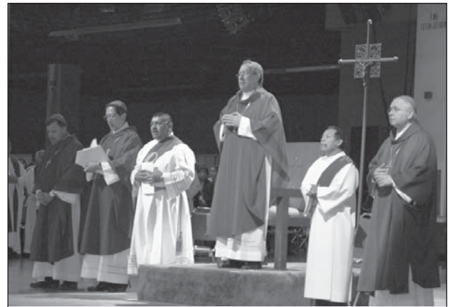
Las Liturgias Eucarísticas siempre has sido una parte importante de la experiencia del Congreso. Este año ofreceremos durante el fin de semana 17 Liturgias diferentes así como servicios de oración.

La violencia en la pareja es un síntoma social, la salud mental es un enfoque para entenderla y atenderla. Cómo es la relación que se establece entre víctima y agresor, qué es la codependencia, que características y problemas tiene el hombre que maltrata a su mujer, qué le ocurre a la mujer víctima y como es la familia donde el maltrato es habitual, serán asuntos a tratar en esta sesión. Igualmente veremos qué les pasa a los hijos en este contexto. Los problemas emocionales, la dificultad para expresar necesidades y deseos, para entender al otro y la inmadurez en el amor (el amor inmaduro es egoísta) son elementos que sostienen relaciones dañinas que, con demasiada frecuencia, terminan en agresiones, asesinatos y suicidios. Veremos cómo se podría prevenir el problema, qué es lo que se está haciendo para ello y si se podrían hacer las cosas mejor. Las medidas que se toman, gran parte de ellas de tipo penal, no parecen estar mejorando el problema. Muchas mujeres siguen estableciendo rela-