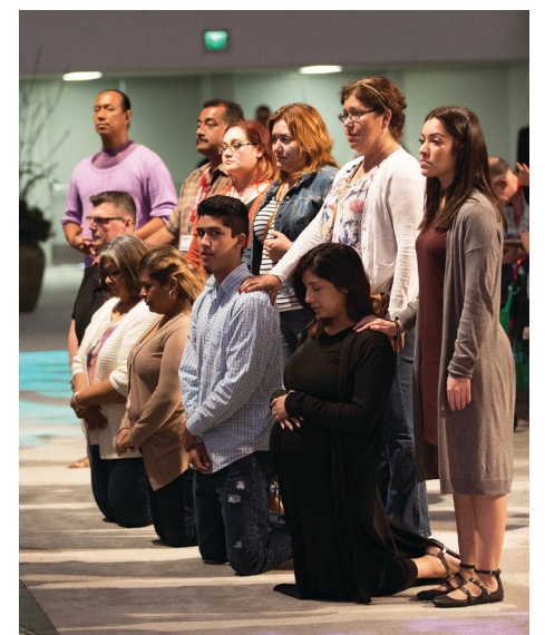
Los Elegidos que serán bautizados en Pascua, participan en el Rito del Escrutinio junto a sus padrinos.

El convivir cristiano es compartir respeto y buenas obras con los demás, por eso necesitamos -como la Samaritana- beber de la fuente de agua viva que es Jesucristo. De este modo, nos podemos compartir con los demás en amor. Así lo recordamos en el Evangelio proclamado y también en el canto-lema oficial del Congreso, que tenía una frase muy pegadiza