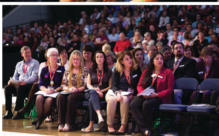
Personal del Departamento de Educación Religiosa, organizadores principales del Congreso.